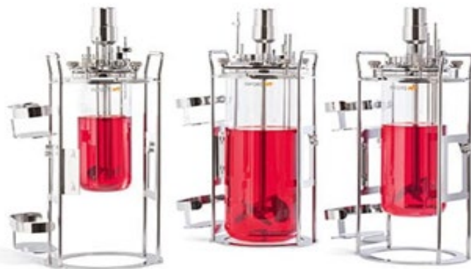
Abbildung 1: Bioreaktoren für die Kultivierung von Stammzellen

Dafür wird eine Zellkultur adulter Stammzellen angelegt. Adulte Stammzellen sind bereits teilweise differenzierte Zellen, die sich jedoch noch häufig teilen können und das Potential haben zu verschiedenen Arten von Muskelzellen heran zu wachsen. Im Gegensatz dazu teilen sich differenzierte Zellen nicht mehr. Diese Stammzellen können durch eine Biopsie aus einem gesunden adulten Tieres gewonnen werden. Das Tier wird dabei nicht verletzt. In einem Bioreaktor, in dem optimierte Bedingungen für die Zellvermehrung herrschen (siehe Abbildung) wächst aus einer Stammzellen ein Klumpen Muskelzellen, an Gerüsten oder Kugeln aus Kollagen.