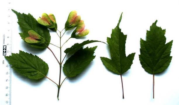
Abb. 5 Tatarische Steppen-Ahorn ( Acer tataricum s.l. )

Abb. 3 - Feld-Ahorn ( Acer campestre ) und Abb. 4 - Spitz-Ahorn ( Acer platanoides ) sind häufig auf europäischen Fluren zu finden. In ihren Samen wurde kein Hypoglycin A nachgewiesen.