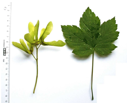
Abb. 1 Berg-Ahorn ( Acer pseudoplatanus )

In neueren Untersuchungen mehren sich Hinweise darauf, dass ein pflanzliches Toxin, Hypoglycin A, für die Erkrankung verantwortlich ist. Hypoglycin A enthalten die unreifen Früchte und Samen der Akee-Pflanze ( Blighia sapida ), die Samen des Eschen-Ahorns ( Acer negundo )- Abb. 2 sowie die Samen des in Europa vorkommenden Berg-Ahorns ( Acer pseudoplatanus )- Abb. 1.