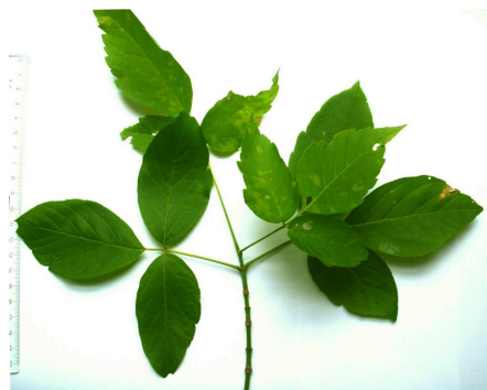
Abb. 2 Eschen-Ahorn ( Acer negundo )