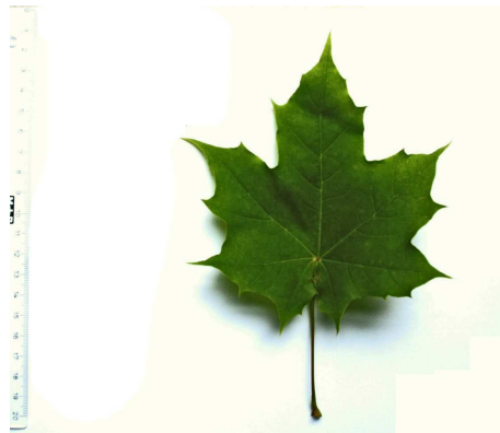
Abb. 4 Spitz-Ahorn ( Acer platanoides )

Abb. 3 - Feld-Ahorn ( Acer campestre ) und Abb. 4 - Spitz-Ahorn ( Acer platanoides ) sind häufig auf europäischen Fluren zu finden. In ihren Samen wurde kein Hypoglycin A nachgewiesen.