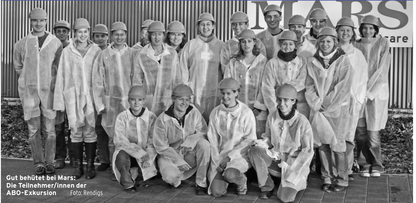
Gut behütet bei Mars: Die Teilnehmer/innen der ABO-Exkursion