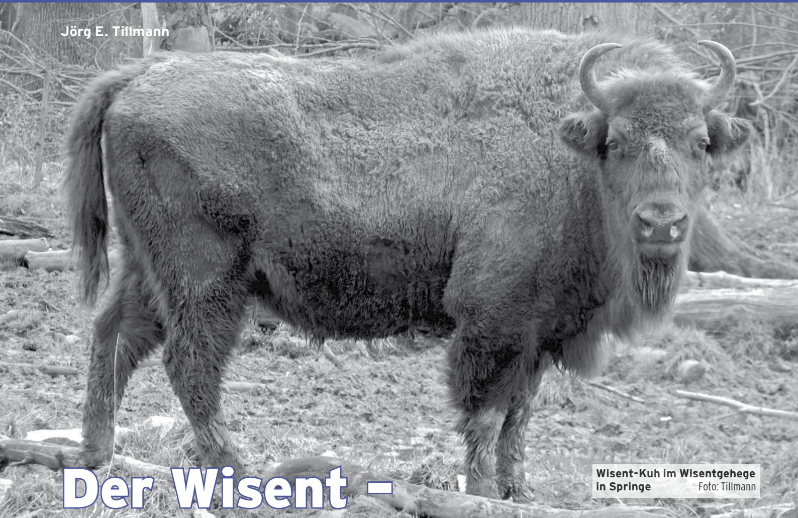
Wisent-Kuh im Wisentgehege in Springe