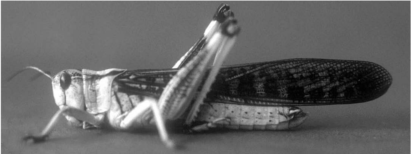
Erwachsene Wanderheuschrecke ( Locusta migratoria , Männchen)

Stickstoffmonoxid regt die Reparatur von Nervenzellen an