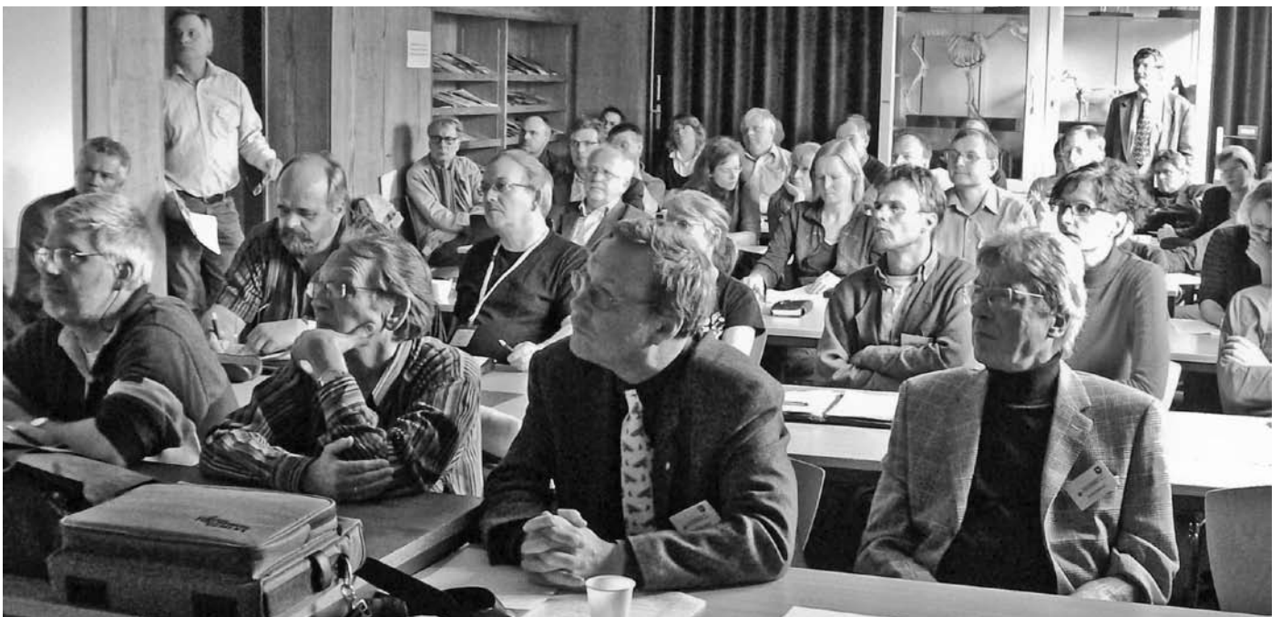
Das Institut für Tierhygiene, Tierschutz und Nutztierethologie richtete einen internationalen Ammoniak-Workshop aus

In der Schlussdiskussion wurde von den Teilnehmern/innen die positive Entwicklung der Ammoniakmessmethodik durch die jährlichen Workshops hervorgehoben, die nun seit sechs Jahren stattfinden. Anfangs trafen sich lediglich elf Teilnehmer/innen, um Messmethoden, -geräte und -ergebnisse zu vergleichen und Analyseverfahren für Ammoniak und andere stickstoffhaltige Verbindungen zu standardisieren. Durch technische Innovationen, durch die Eichung zumindest aller deutschen Geräte im Rahmen gemeinsamer Ringversuche und durch die Vereinheitlichung der Messprotokolle, in die nun auch die Temperatur, die Messhöhe und die Wetterdaten einbezogen werden, erzielen die Kontrollstellen heute wesentlich aussagekräftigere Resultate und eine bessere Vergleichbarkeit der Messergebnisse. Der inzwischen auf 47 Angehörige angewachsenen Gemeinde von Wissenschaftlern/innen, die auf dem Gebiet der Ammoniak-Forschung tätig sind, hat die Tagung inhaltlich und organisatorisch so gut gefallen, dass auch der siebte Workshop wieder an der Stiftung Tierärztliche Hochschule Hannover im Institut für Tierhygiene, Tierschutz und Nutztierethologie stattfinden soll.