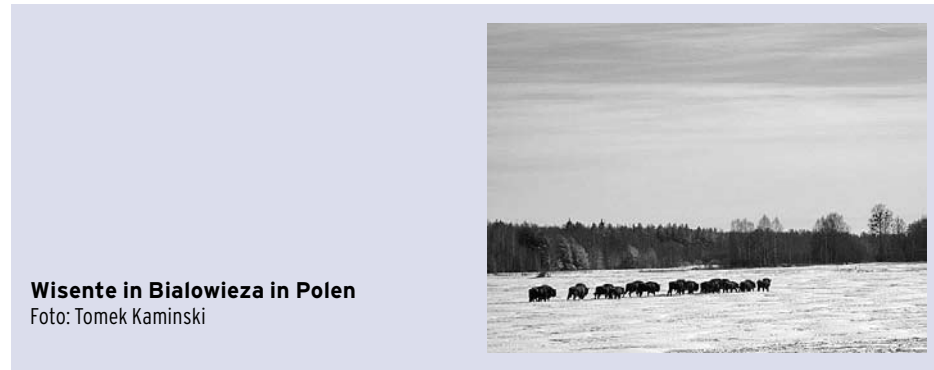
Wisente in Bialowieza in Polen